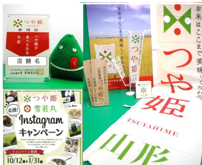
(上)つや姫が食べられるお店登録証 (下)キャンペーン企画(例)