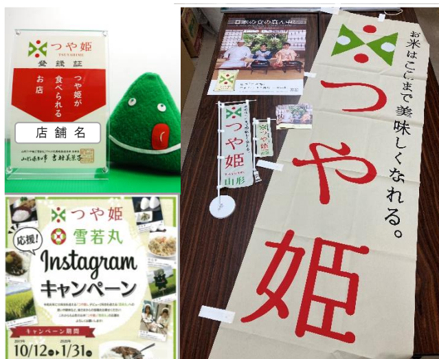
(上)つや姫が食べられるお店登録証 (下)キャンペーン企画(例)