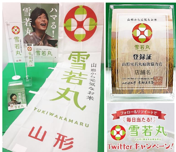
(左)販促資材セット(例)