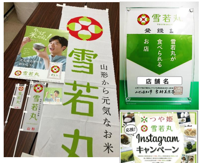
販促資材セット(例)