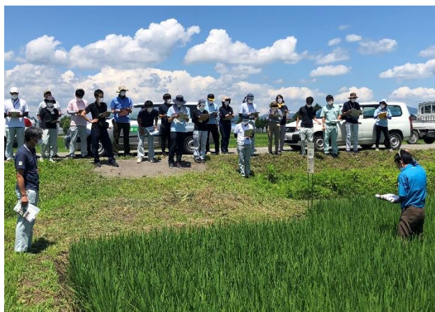
熱心に研修を受ける参加者（7月16日）

日々現場に足を運び、生産者に寄り添って栽培技術指導を行っている県の普及指導員。県内各地の特徴的な取組みを学ぼうと、生産者のほ場などを巡り研修を行いました。参加者は、スマート農業を取り入れた大規模経営の現場や、大豆づくりで長年高品質・高収量を達成している農事組合法人の取組みを実際に目にし、大きな刺激を受けた様子でした。