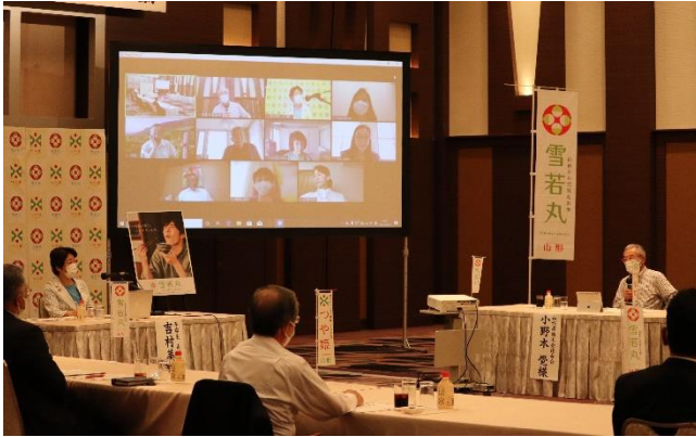
遠方の委員はリモートで参加し、活発な議論が交わされました