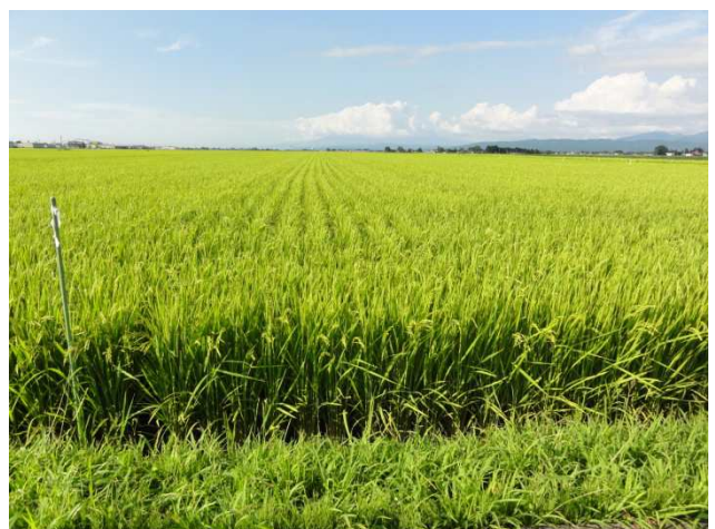
綺麗に出揃った「はえぬき」の稲穂