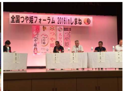
「つや姫フォーラム」inしまね