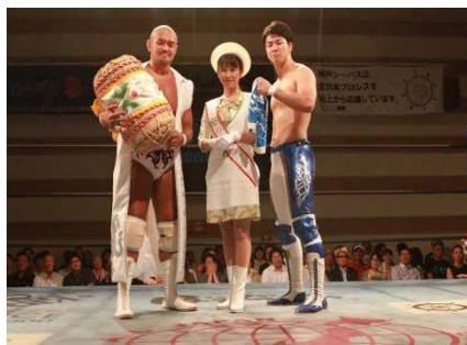
全日本プロレス試合会場